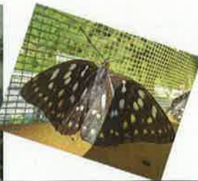
【オオムラサキの放蝶】

「まつやま・いじめ0の日」だけに限らず、学校生活のいろいろな場面で、「つながり」を意識した活動は行われています。今後も、五明地区の特色を生かしながら、明るく健全な学校生活を送れるようにしていきたいと思ひます。